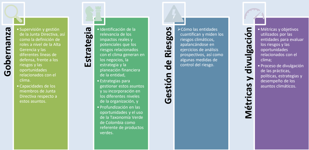
Gráfica 1. Dimensiones de la encuesta de riesgos y oportunidades climáticas

A continuación, se presentan las principales conclusiones para cada dimensión, sin perjuicio de que próximamente se publicará el informe completo en el micrositio de finanzas sostenibles de la SFC, junto con una herramienta de visualización de información que contiene gráficas dinámicas con los resultados para todas las industrias encuestadas.