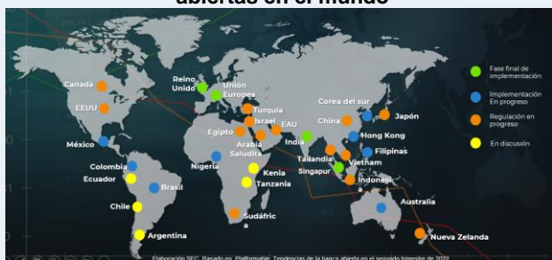
Gráfica 1. Aproximación regulatoria de finanzas abiertas en el mundo