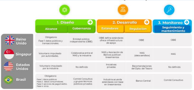
Gráfica 2. Pilares de las estrategias de arquitectura de finanzas abiertas sostenible y competitiva