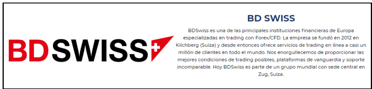
Imagen tomada el 5 de marzo de 2021 de HTTPS://CAPITALUP.CO/PRODUCTOS