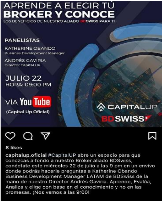
Imagen tomada el 5 de marzo de 2021 https://instagram.com/capitalup.official?igshid=cxpglpztdhss

Perfil activo 13 , a través del cual se identifican diversas publicaciones relativas a la promoción de sus actividades de formación en habilidades para “trading”; igualmente se observan las mismas piezas graficas utilizadas en la cuenta de Facebook, donde se evidencia el uso de la imagen corporativa de la entidad del exterior BDSwiss en invitaciones a conversatorios, en donde el panelista es el señor ANDRES FERNANDO GAVIRIA AZA director CAPITAL UP.