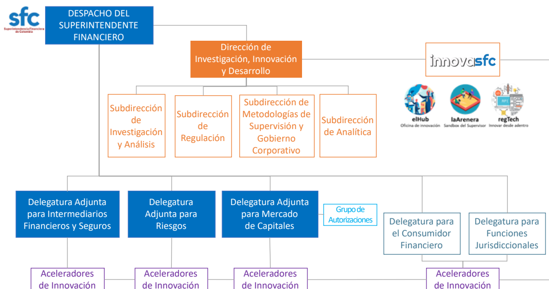
Gráfica 1. Organigrama de la SFC e innovasfc