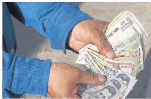
Con créditos de bajo monto se busca combatir a los 'gota a gota'.

"Esto tiene que ver, específicamente, con el tema de provisiones y otros aspectos normativos que deben cumplir las entidades. La idea es que esto arranque de una vez por todas", dijo