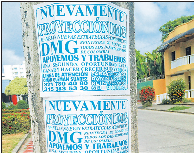
En La Castellana los volantes invitan a participar de DMG.

La Superfinanciera invitó para que los monterianos "no caigan en los crecimientos de ganancias rápidas, exageradas y fáciles. Se están aprovechando de su