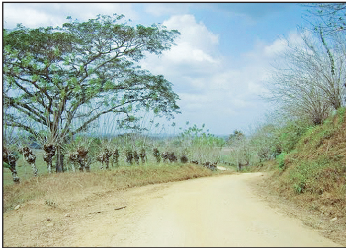
En zona rural de El Viajano fue hallado el yacimiento de gas.

"Se habla de unos 500 millones de pies cúbicos diarios de gas, que es un yacimiento grandecito que nos ayudará mucho para