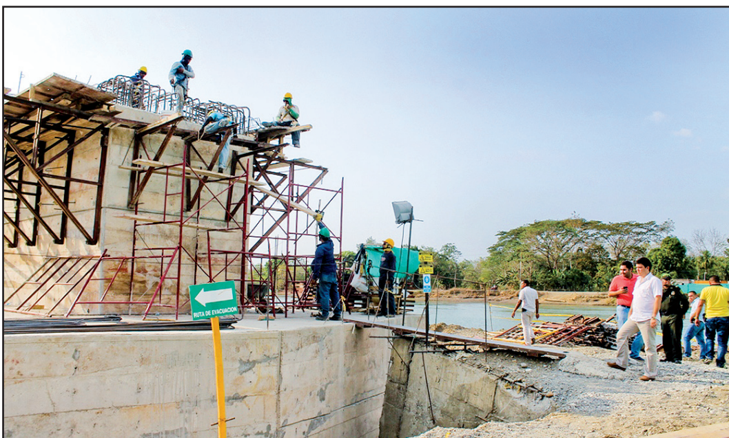
El gobernador de Córdoba pudo constatar los avances de la obra en Valencia.

"El puente de Valencia presenta un avance en su ejecución del 20%, ya pasó la ruta crítica y tenemos la expectativa de que en el mes de agosto o septiembre se entregue la superestructura, de acuerdo a lo manifestado